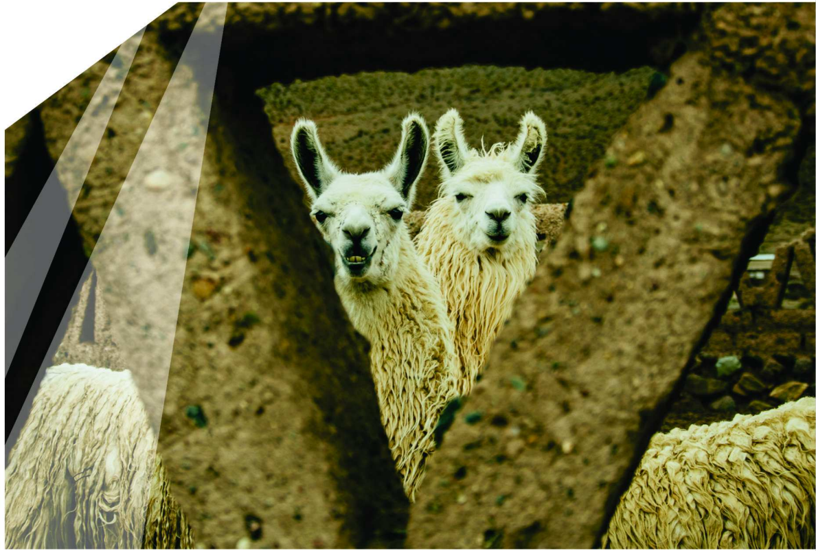
San Antonio de los Cobres