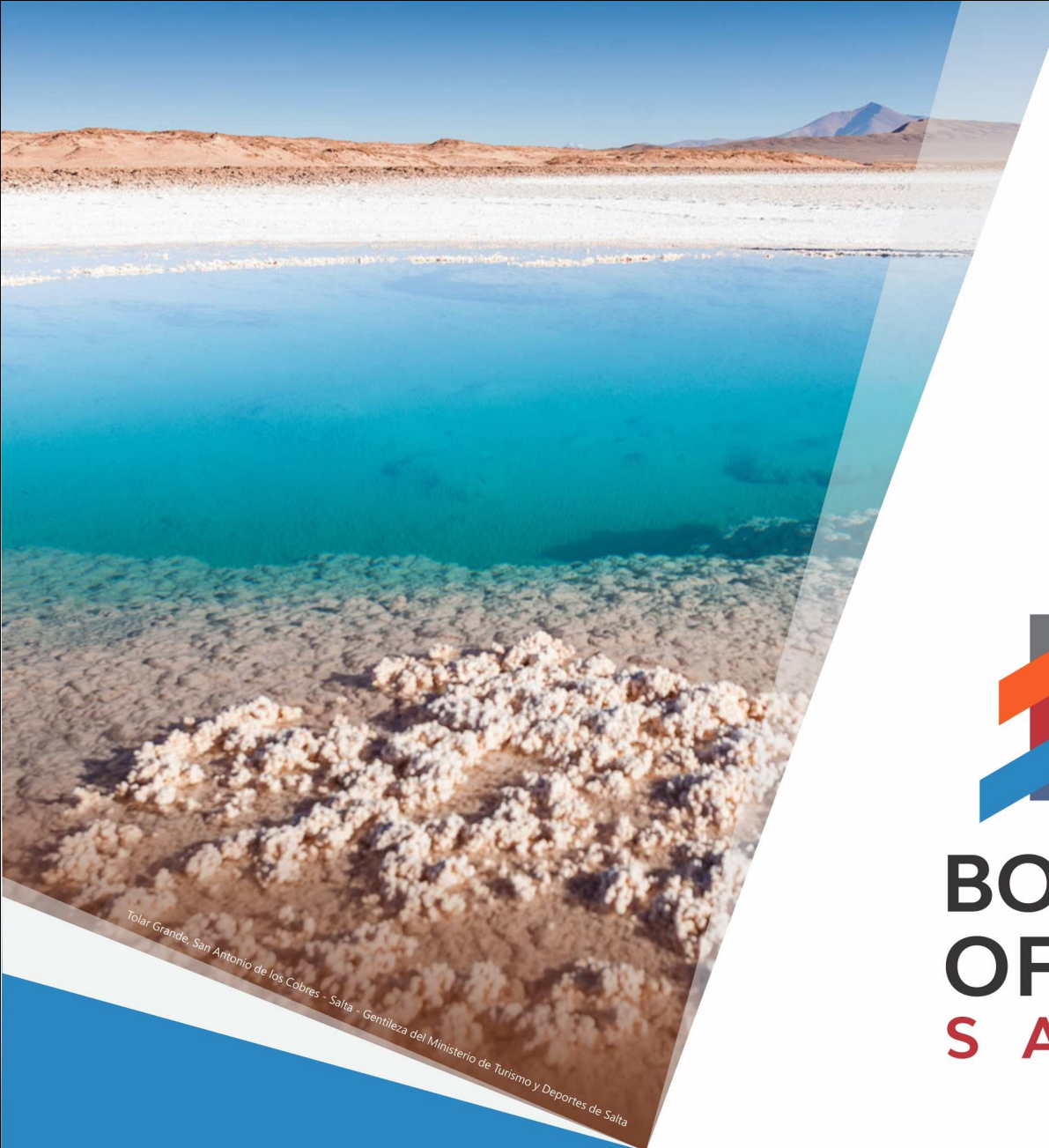
Tolar Grande, San Antonio de los Cobres - Salta