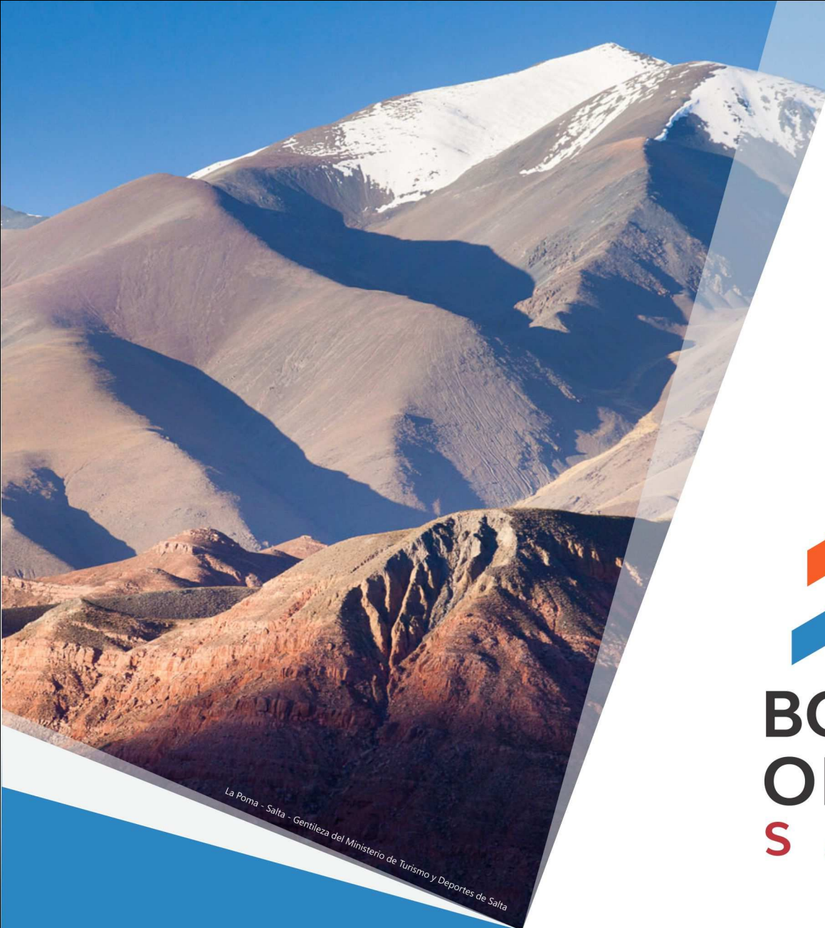
La Poma - Salta