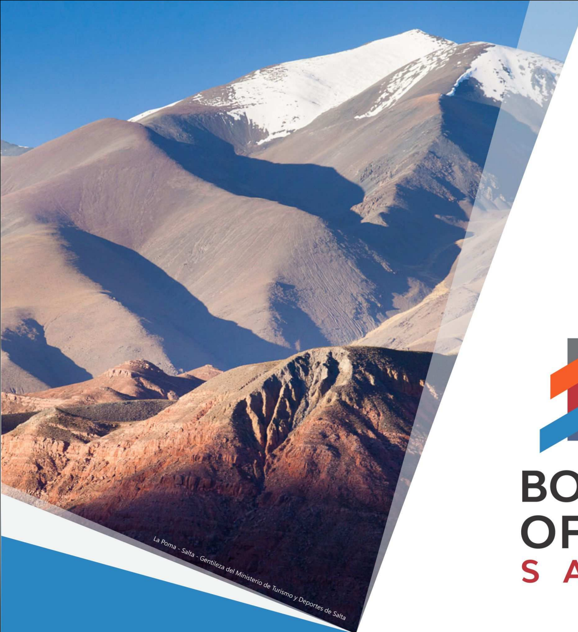
La Poma - Salta