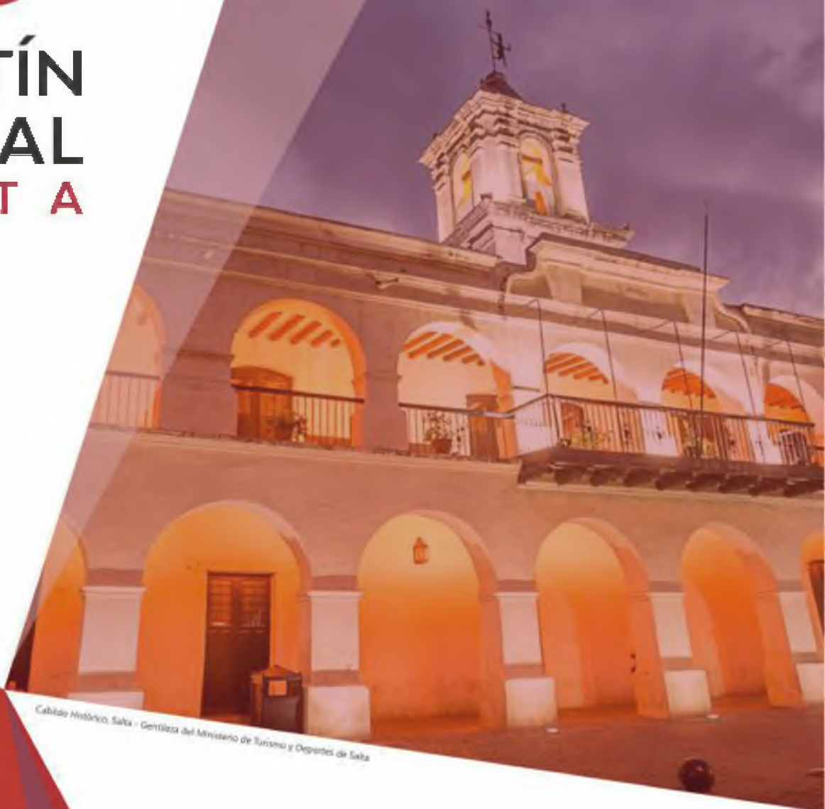
Cabildo Histórico Salta