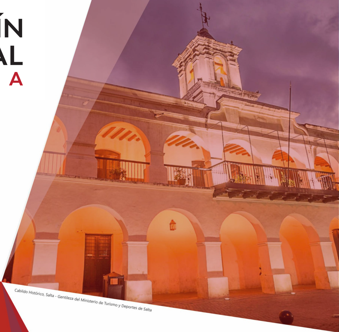
Cabildo Histórico, Salta