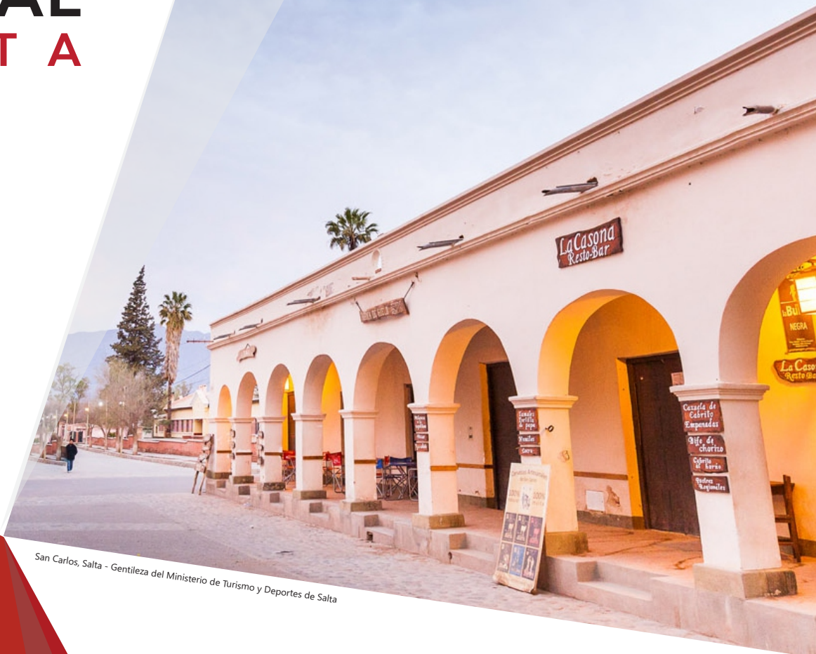
San Carlos, Salta